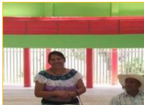
Imagen 2. Traje de mujeres