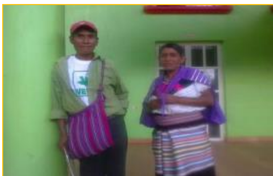
Imagen 1. Traje de hombres

Los trajes típicos que se utilizan en la región se caracterizan por incluir una variedad de colores, en el caso de las mujeres (imagen 2) la vestimenta se compone de nahua adornada con listones de colores y blusa blanca con vuelo bordado en colores rojo, verde y celeste; también utilizan velos y trenzas con listones rojo, para lo hombres (imagen 1) la vestimenta consiste en pantalón y camisa.