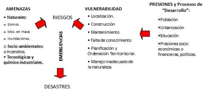
Figura 1. Conceptos de Riesgo.