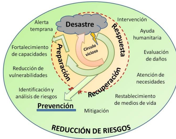
Figura 1. Ciclo del Riesgo.

RECUPERACIÓN (O RECONSTRUCCIÓN): recuperación a corto plazo de los servicios básicos e inicio de la reparación del daño físico, social y económico; lo que incluye esfuerzos para reducir los factores de riesgo de desastres futuros.